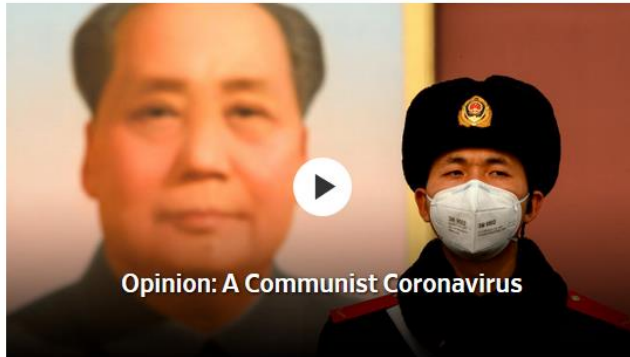
Opinion: A Communist Coronavirus

China's political system is eventually going to damage the world, by ac